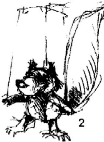
Enzo, de kleine, rode wolf

Hierna ziet u enkele schetsen van de poppen die werden gemaakt, op basis van de illustraties van Rocío Del Moral.