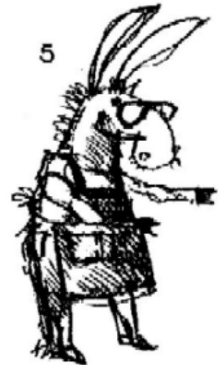
Meneer Spullemans, de ezel, winkelier (bij hem kan je alles kopen)