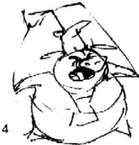
Meneer Knor, het varken, uitbater vaneen pizzarestaurant